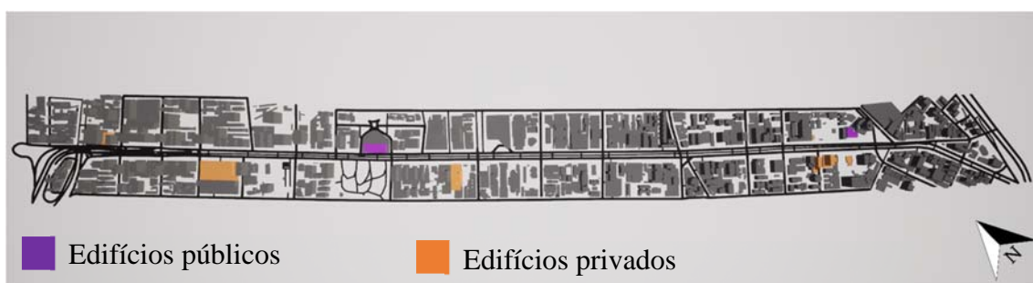
Figura 1. Avenida Paulista

Fonte: Twinmotion 2020. Desenho das autoras.